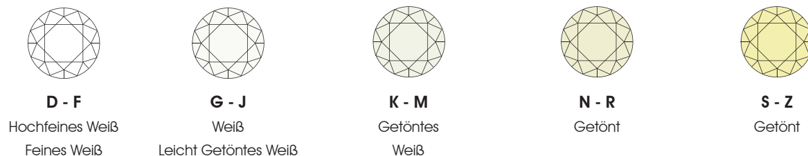
D - F Hochfeines Weiß Feines Weiß G - J Weiß Leicht Getöntes Weiß K - M Getöntes Weiß N - R Getönt S - Z Getönt