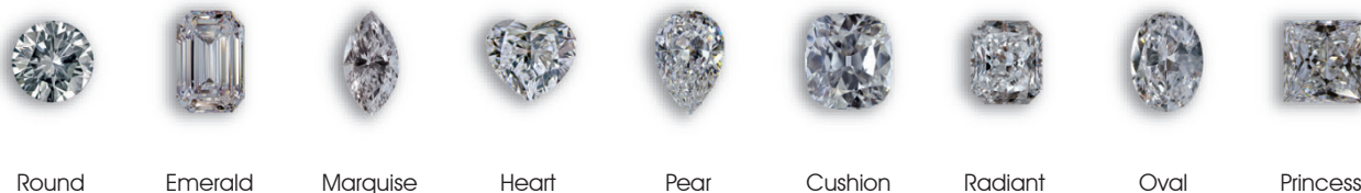
Round Emerald Marquise Heart Pear Cushion Radiant Oval Princess