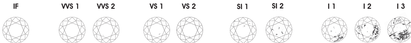
IF Internally Flawless Keine sichtbaren inneren Mängel bei 10 facher Vergrößerung (eine winzige äußere Kleinigkeit ist erlaubt) VVS 1 Very very slight Bei 10facher Vergrößerung sehr schwer festzustellende Einschlüsse. VVS 2 VS 1 Very slight Bei 10facher Vergrößerung schwer festzustellende Einschlüsse. VS 2 SI 1 Slightly imperfect Bei 10facher Vergrößerung leicht festzustellende Einschlüsse und äußere Mängel. SI 2 I 1 Imperfect Mit bloßem Auge leicht festzustellende Einschlüsse und äußere Mängel. I 2 I 3